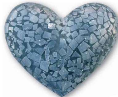
■ 18x14x5cm. Μαύρο μάρμαρο Αγ. Πέτρου Κυνουρίας και εποξική ρητίνη με χρωστική. St Peter's of Kynouria black marble with coloured epoxy resin.