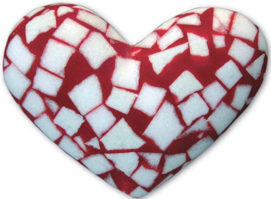
■ 18x14x5cm. Μάρμαρο θάσου και εποξική ρητίνη με χρωστική. Thassian marble and coloured epoxy resin.