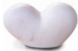
■ 18x12x5cm. Μάρμαρο Αγίας Μαρίνας Αττικής. St Marina's of Attika marble.

Από το 1996 συνεργάζεται με τη Γαλλική Αρχαιολογική Σχολή στη Δήλο. Συμμετοχή με την ιδιότητα του ειδικού ερευνητή στην εκπόνηση του προγράμματος «Ξέστρον» του Εθνικού Ιδρύματος Ερευνών για το μάρμαρο στο Αιγαίο.