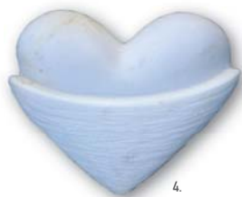
1. 30x14x5cm, Μάρμαρο Διονύσου Πεντέλης, Dionysos Pedeli's marble . 2. 4. 5. 18x14x5cm, Μάρμαρο θάσου, Thassian marble . 3. 18x14x5cm, Μάρμαρο Διονύσου Πεντέλης, Dionysos Pedeli's marble .